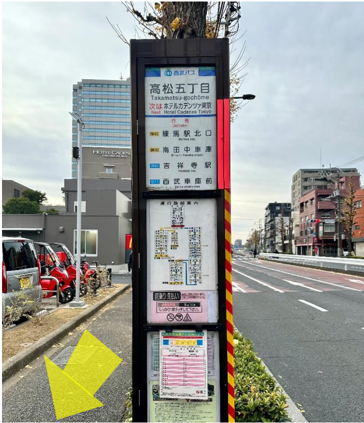
7 「高松五丁目」で下車。降りたら左（バスの進行方向と逆）に進みます。