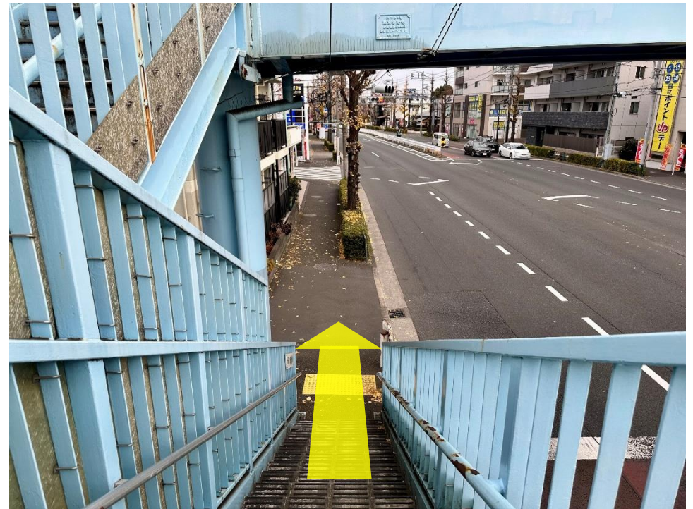
10 歩道橋を下りたらまっすぐ進みます。