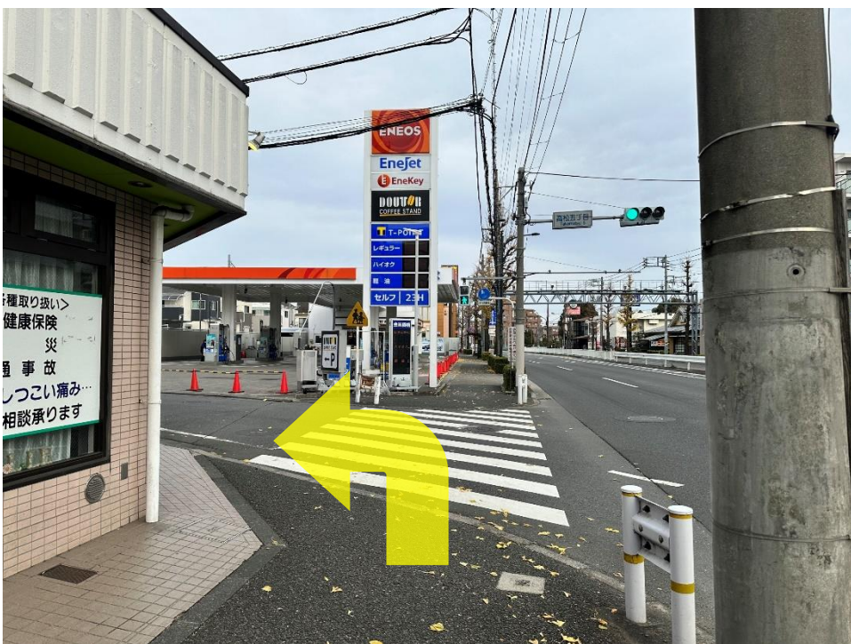
11 ガソリンスタンドの手前を左に曲がります。