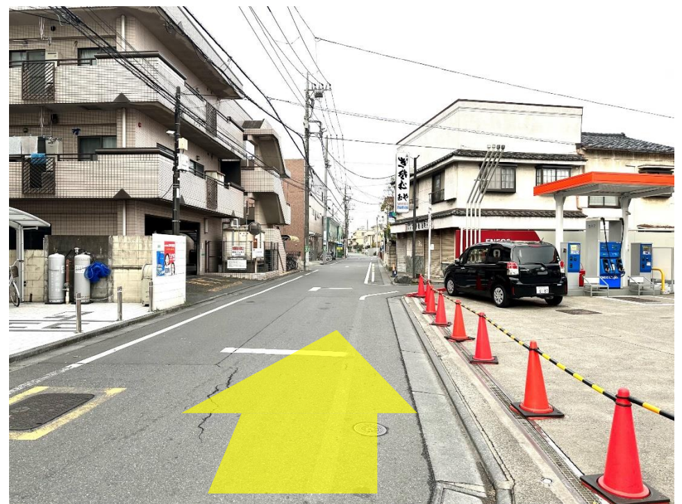
12 まっすぐ進んでいきます。ここから学校まで約7分です。