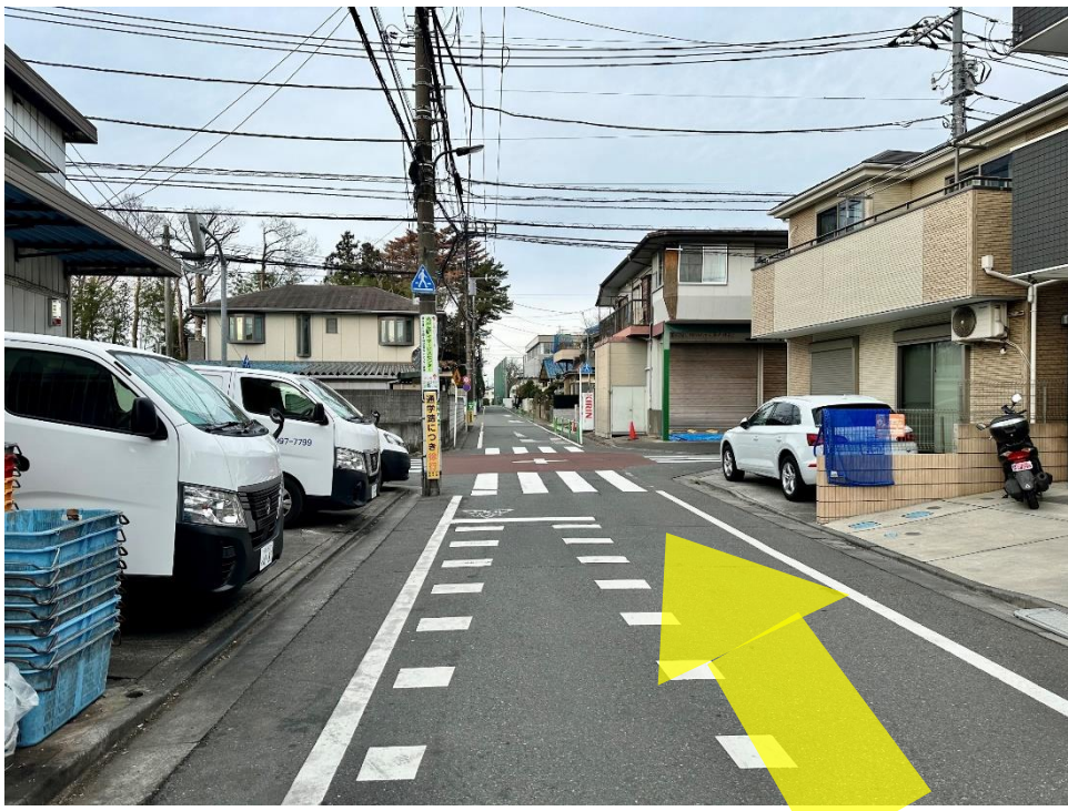
15 2つ目の交差点もまっすぐ進みます。2分ほど歩くと右側に正門があります。