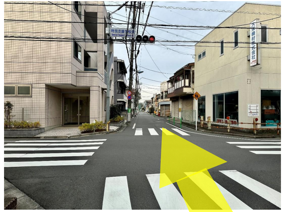
14 郵便局を過ぎると信号のある交差点があります。まっすぐ進みます。