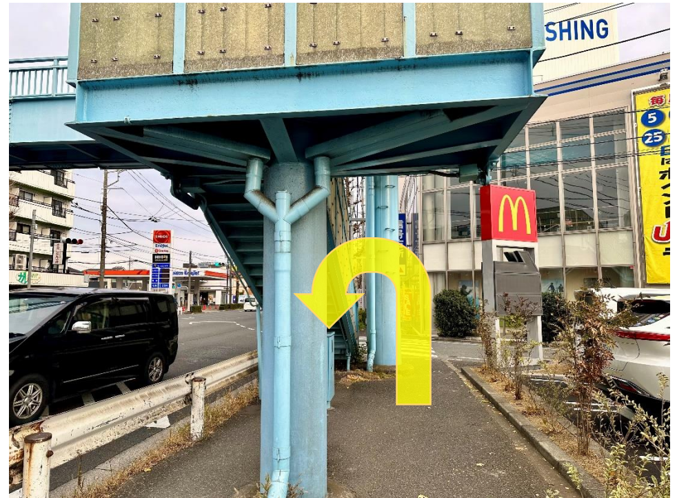
8 バス停のすぐ近くに歩道橋があります。