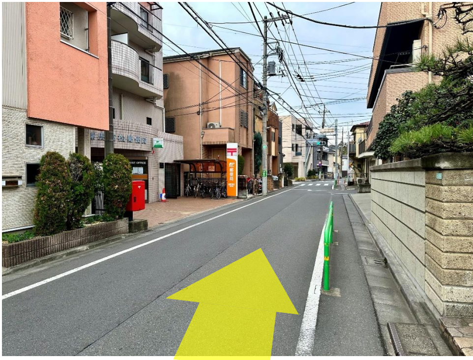
13 3分ほど歩くと左側に郵便局が見えます。