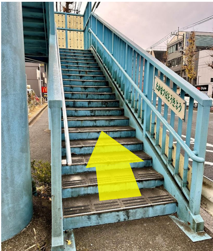
9 歩道橋を上り、道路の反対側に渡ります。